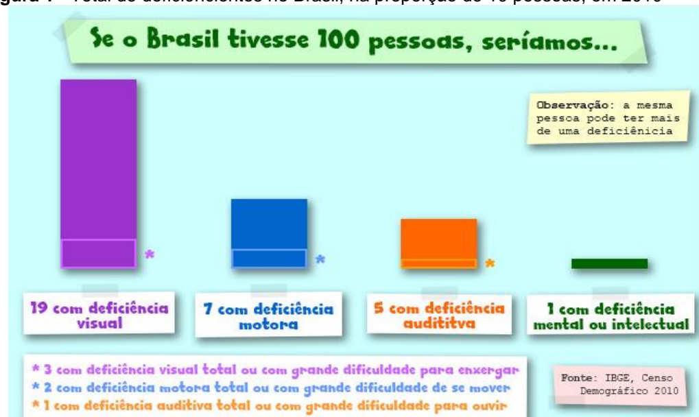
Figura 1 - Total de deficientes no Brasil, na proporção de 10 pessoas, em 2010