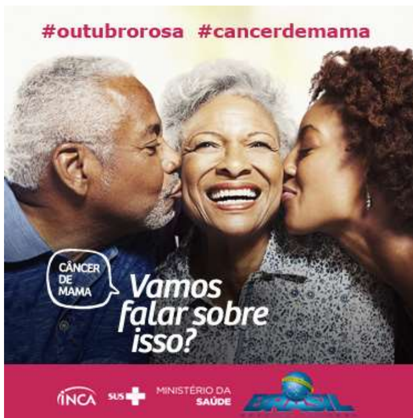
Figura 4 – Cartaz Câncer de mama: vamos falar sobre isso? 2016 - 2017