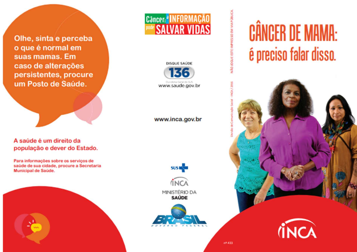
Figura 3 – Capa da cartilha “Câncer de mama: é preciso falar disso”