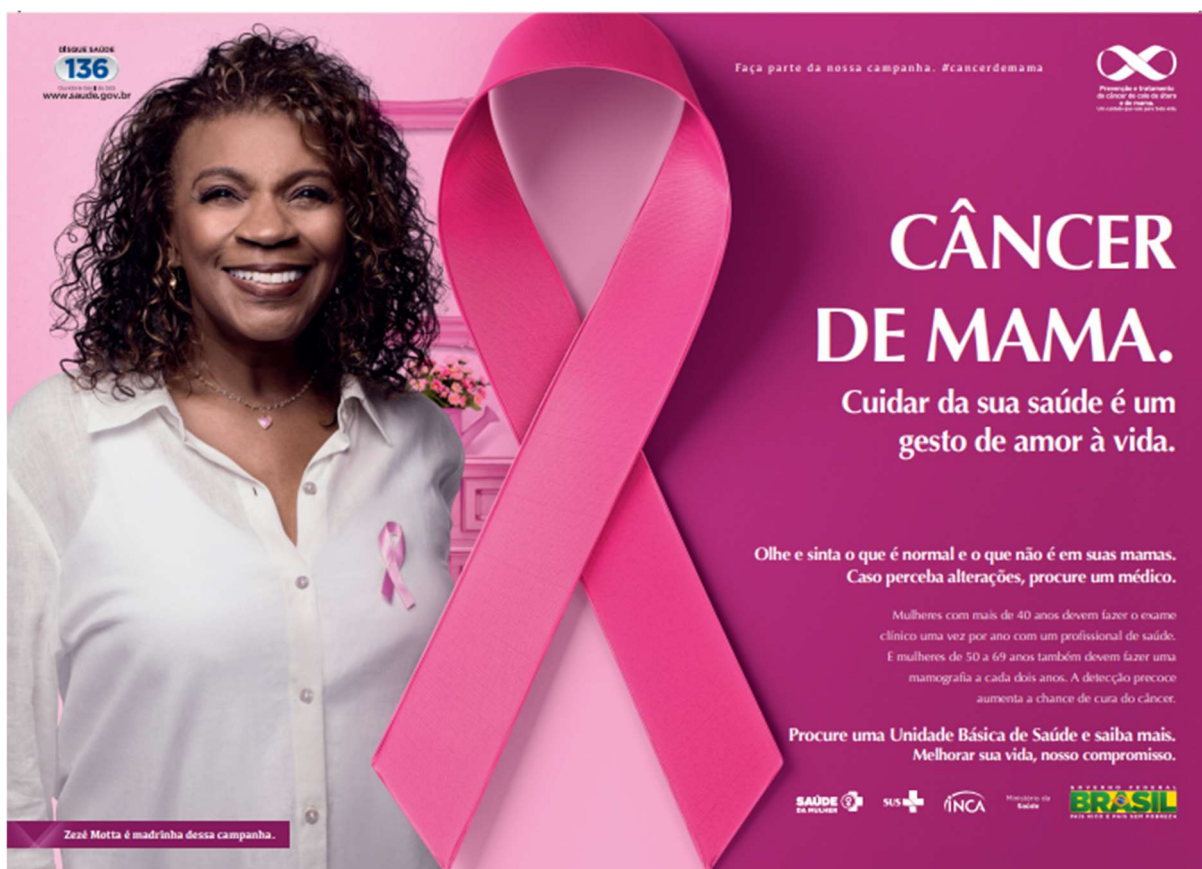
Figura 2– Cartaz Câncer de mama - 2013